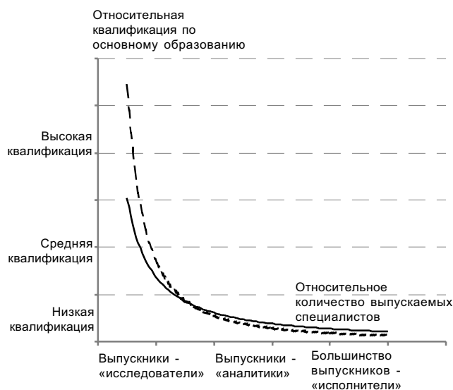
Рис. 3. Необходимые изменения в количестве и квалификации специалистов в шестом экономическом укладе

Во-вторых, переход к шестому технологическому укладу, в особенности для России, предполагает ускоренное, с опережающим темпом развитие науки и технологий, которые требуют гораздо более высокого уровня специалистов. Для вузов это означает, что «обычное» распределение специалистов по осям «количество - качество» должно быть существенно сдвинуто (см. рис. 3, пунктирная кривая).